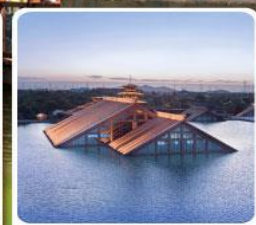
พิพิธภัณฑ์ไดน้ำกงฟู่หลิน