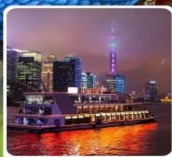
ล่องเรือแม่น้ำหวงผู่