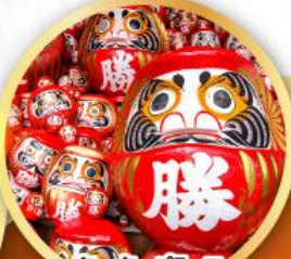
วัดคิตสึโงจิ (วัดदारุมะ)

ชมความงามของกำแพงหิมะ เส้นทางสายอัลไพน์ ทากายามา (JAPAN ALPS SNOW WALL)