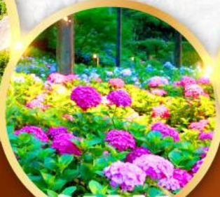
วัดมิมุโระโงจิ