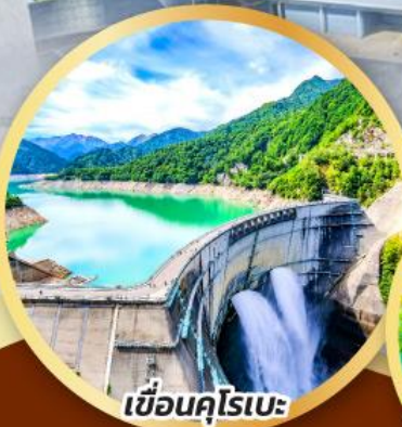
เขื่อนคุโรเบะ