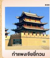
กำแพงเจียอี้กวน