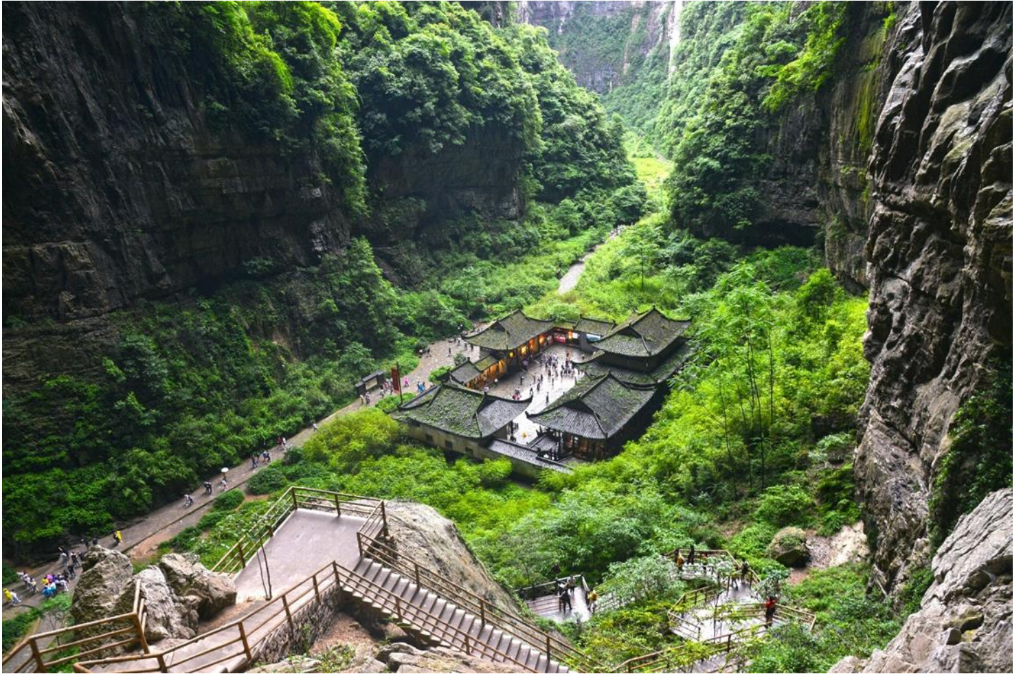
กลางวัน รับประทานอาหารกลางวัน ณ ภัตตาคาร (มื้อที่ 5)