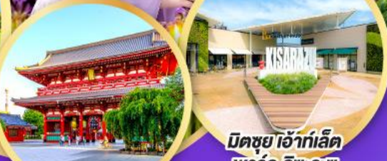
มิตซึย เอ้าท์เล็ต พาร์ค คิซึระซึ