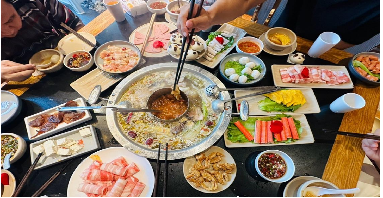
คำ รับประทานอาหารคำ ณ ภัตตาคาร (เมื่อที่ 12) *เมนูพิเศษสุกี้หมाल่าเสวน