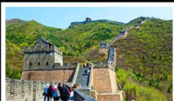
กำแพงเมืองจีนด่านจวิยงกวน