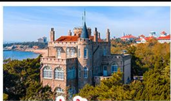
ป่าต่ากวน

พระราชวังฤดูร้อน - วิวเมืองซิงเต่า รถไฟความเร็วสูง - ภูเขาเหลาซาน กำแพงเมืองจีนด่านจวิยงกวน - ป่าต่ากวน พักโรงแรมระดับ 4 ดาว - ไม่หลงร้านช้อปปิ้ง มือพิเศษ เปิดปักกิ่ง , หม้อไฟซีฟู้ด