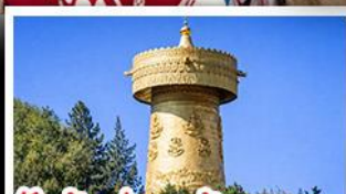
วัดต้าฝอ กงล้อมณฑล