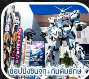
ช้อปปิ้งชินจูกุ+กินคิมยักซ์