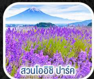
สวนไอชิ ปาร์ค