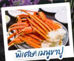
พิเศษ! เมฆงาปู