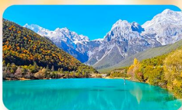
ทะเลสาบไป๋สุยเหอ