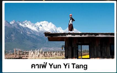
คาเฟ่ Yun Yi Tang