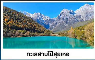
ทะเลสาบโป๋ส่วยเหอ