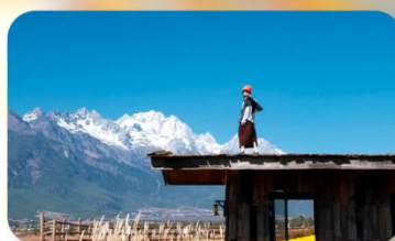
กาแฟ Yun Yi Tang