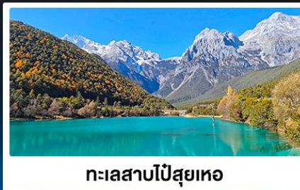
ทะเลสาบโป๋สุยเหอ