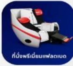
ที่นั่งพรีเมียมฟเลกซ์