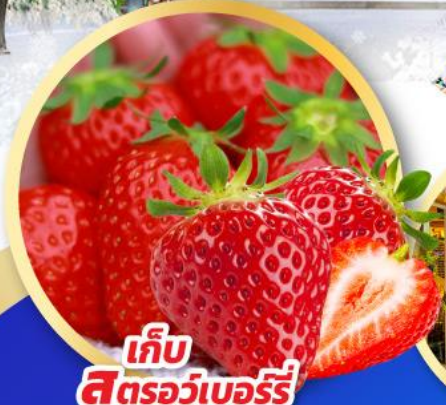
เก็บ สตรอว์เบอร์รี่