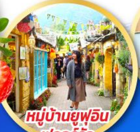
หมู่บ้านยูฟุอิน ฟลอร์ริล