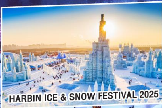
HARBIN ICE & SNOW FESTIVAL 2025