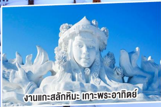
งานแกะสลักหิมะ เกาะพระอาทิตย์