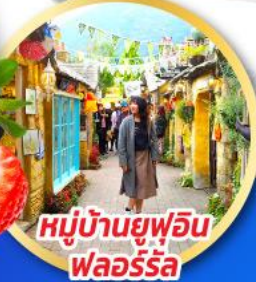
หมู่บ้านยูฟูอิน พลอร์ริล