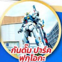
กันดั้ม.ปาร์ค ฟุกุโอกะ