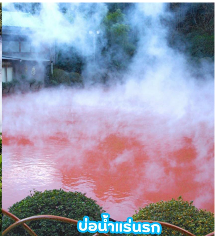
บ่อน้ำแร่รถ