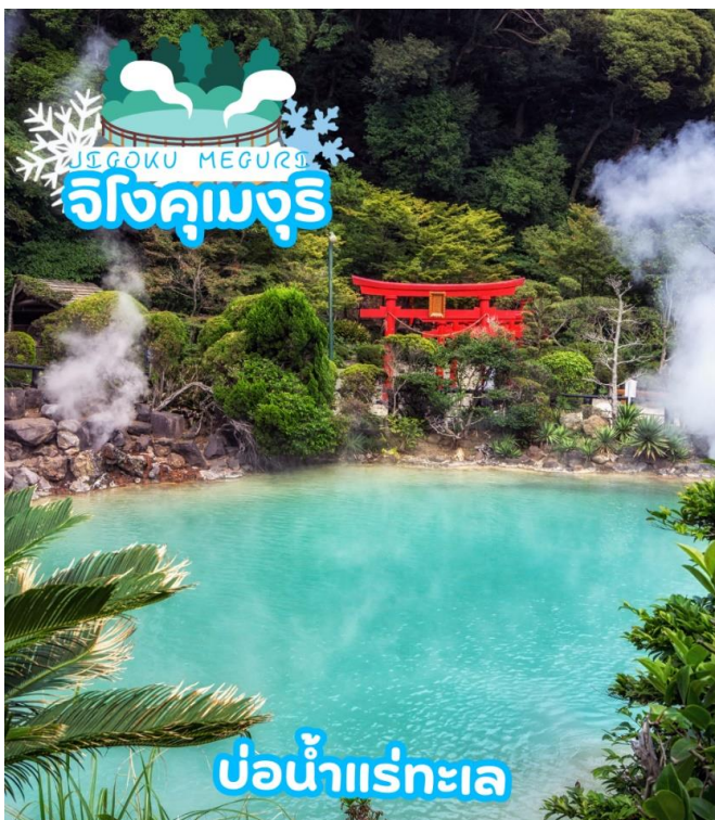
บ่อน้ำแร่ทะเล

ได้เวลาอันสมควรนำท่านเดินทางสู่ เมืองเบปปุ (Beppu) เมืองในจังหวัดโออิตะ ตั้งอยู่บนชายฝั่งทะเลตะวันตกของเกาะคิวชู ประเทศญี่ปุ่น เป็นเมืองท่องเที่ยวแช่น้ำพุร้อนยอดนิยมของญี่ปุ่น จัดเป็นเมืองที่มีรีสอร์ตน้ำแร่มากที่สุด นักท่องเที่ยวนิยมมาแช่ออนเซนหรืออบทรายร้อนริมทะเลที่เมืองนี้