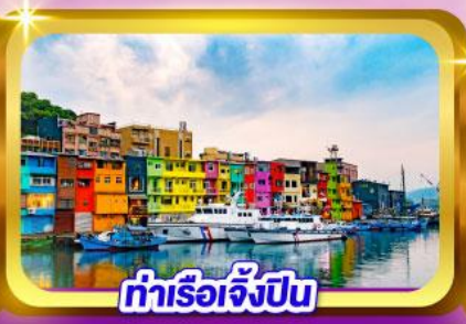
ท่าเรือเจิ้งปิ่น