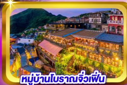
หมู่บ้านโบราณจิวเฟิ่น