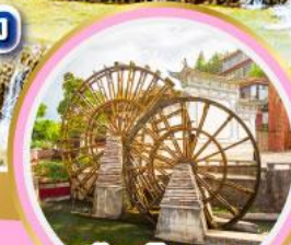
เมืองโบราณ ลี่เจียง