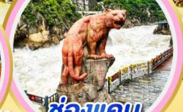
ช่องแคบ เลือกระใจ