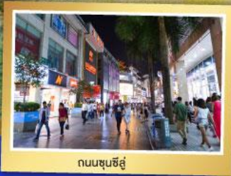
ถนนชุนชิว