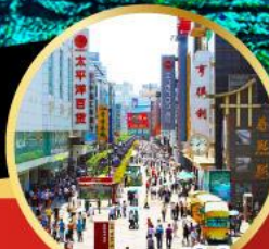
ถนนชุนชี่ลู่