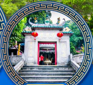
วัดอามา มาเก๊า