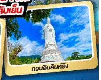
กวนอิมลิน्हอิ่ง