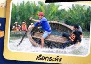
เรือกระด้ง