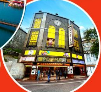
ร้าน POP MART ใหญ่ที่สุดในไต้หวัน